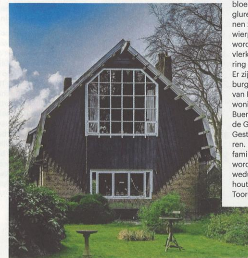
De atelierwoning van Charley Toorop, Buerweg 19.