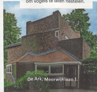
De Ark, Meerwijklaan 1.

Maarten Min wijst op de bovenramen van de Bark die in hun geheel naar beneden kunnen worden geschoven en de gemetselde brug over de Broekbeek van Margaret Kropholler, bol en hol tegelijk. Zo zijn er meer bijzondere details, zoals de holtes in de gevel van villa Meerhuis (Meerwijklaan 7) om vogels te laten nestelen.