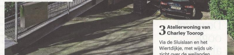
Modernistische villa, Meerweg 4.

Een heftig contrast met de rieten kappen en golvende lijnen is de strakke modernistische villa (1999) met loopbrug aan de rand van het bos (Meerweg 4), een ontwerp van Marc Prozman architecten. Omdat het huis niet groter en hoger mocht worden dan de oorspronkelijke woning, is het opgeteld, waardoor ruimte ontstond voor een carport die niet meetelt bij het bouwvolume. Helaas is de half-open patio aan de tuinkant vanaf straat zichtbaar, maar afgaand op de foto's in het boek lijkt de villa haast te versmelten met het bos.